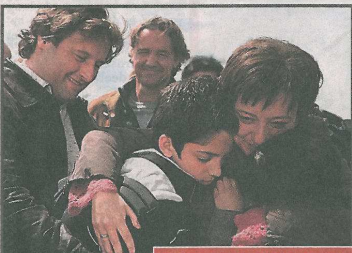
■ Moeder Janneke vocht jarenlang voor haar kinderen.

AMSTERDAM – Hutten bouwen, door de modder rollen en in bomen klimmen, scouting lijkt typisch een hobby voor jongens. Toch zijn er, al vanaf het ontstaan van scouting in Nederland, honderd jaar geleden, ook veel meisjes scout. Ze zijn niet allemaal even stoer, maar wél actief. Ze maken reizen naar het buitenland, organiseren kampen of koken voor tweeduizend man.