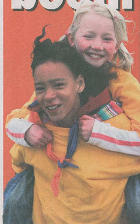
■ Scouting is een natuurlijke speeltuin. Spelenderwijs worden er vaardigheden ontwikkeld.